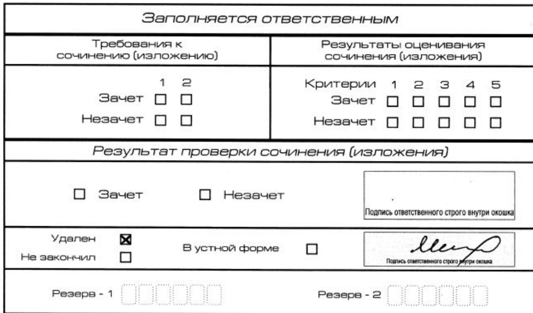
Рис. 12. Заполнение полей нижней части бланка регистрации (удаление с экзамена)

(участник итогового сочинения (изложения) должен поставить свою подпись в указанной форме). В бланке регистрации указанного участника итогового сочинения (изложения) необходимо внести отметку «X» в поле «Удален». Внесение отметки в поле «Удален» подтверждается подписью члена комиссии по проведению итогового сочинения (изложения) (рис. 12).