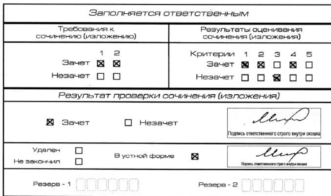
Рис. 10. Область для оценки работы сочинения (изложения) в устной форме

После окончания заполнения бланка регистрации ответственное лицо ставит свою подпись в специально отведенном для этого поле.